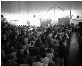
La misa del 7º aniversario de la Radio tuvo un marco multitudinario.

Un par de días antes se había celebrado en el Colegio del Huerto de Córdoba el 7º aniversario de la Radio con una gran concurrencia. En esa oportunidad las personas que participaron de la misa llevaron alimentos no merecedores en gran número para el Comedor San José. ■