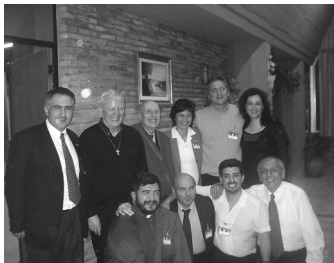
La delegación argentina junto a varios integrantes de la Familia Mundial.

Por último, el Padre Soterías recordó: "Hoy Radio María está presente en 48 países del mundo y están a la espera de salir 12 naciones más. El desarrollo ha sido una de las líneas marcadas por la Familia Mundial para los próximos tres años y a esto se le suma la necesidad de consolidar la Obra en cada asociación y como familia toda desde la formación". En cuanto al desarrollo del carisma, el Director de Radio María Argentina manifestó que "nos abrimos a la marca de identidad que Dios quiere poner en estos tiempos de fundación". ■