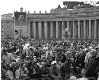
Todos los participantes del Congreso en la Plaza de San Pedro, a la espera del Papa.

Cabe aclarar que el 3º Congreso de la Familia Mundial contó con la presencia de todos sus miembros. Dentro de la lista de los países invitados se incluyeron no sólo a aquellos en los cuales la Radio ya está funcionando sino a los que están dando sus primeros pasos y a los que todavía no tienen su figura jurídica armada, como es el caso de Suiza y Nueva Guinea (esta será la primera emisora en el