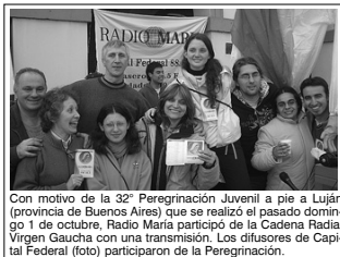
Con motivo de la 32ª Peregrinación Juvenil a pie a Luján (provincia de Buenos Aires) que se realizó el pasado domingo 1 de octubre, Radio María participó de la Cadena Radial Virgen Gaucha con una transmisión. Los difusores de Capital Federal (foto) participaron de la Peregrinación.

Si sentís el llamado a ofrecerte como voluntario de Radio María en un tiempo y actividad concreta, podés comunicarte con el área del Voluntariado escribiendo a: voluntariado@radiomaria.org.ar o acercarte personalmente a Av. Velez Sarfield 51 1º piso, de 9 a 17 horas.