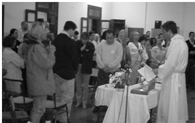
El retiro del 2003 fue el primero que todos los integrantes de la Obra vivimos en forma unificada.

Luego de participar de un retiro del Movimiento de la Palabra en Córdoba, la Obra de Radio María inició a mediados de 2002 un proceso pastoral muy rico, con la apertura de fraternidades o grupos de oración. A cargo de esta tarea estuvo y está el Servicio Pastoral, que tiene como objetivo guiar espiritualmente y ayudar a descubrir la presencia amorosa de Dios en las vidas de las personas que forman parte de la Radio y en su servicio de entrega cotidiana. Durante todo el 2002, la Obra creció en una fuerte espiritualidad centrada en la escucha atenta de la Palabra de Dios y la intención de encarnar ese mandato.