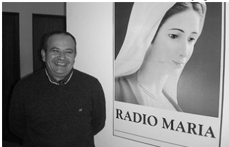
El amor del sacerdote hacia Radio María es muy grande.

En lo personal el Padre tiene "una gratitud enorme por la Radio". Hace unos 8 años comenzó a realizar distintos programas