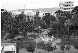
Una vista panorámica de la plaza principal de la capital jujeña.

Por último, el Obispo jujeño celebró que "gracias a la Radio se pue-