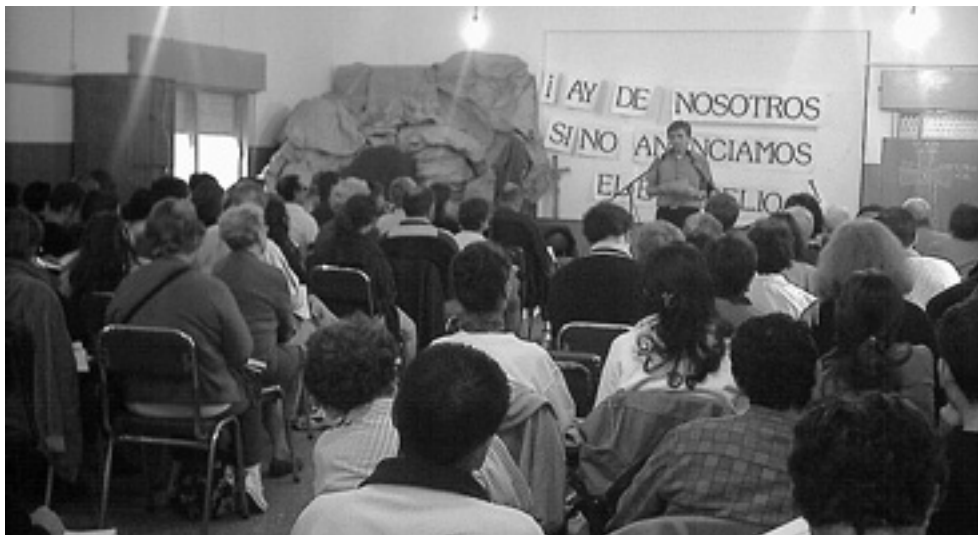
El retiro de Pascua de 2004 se vivió intensamente.

El año 2004 comenzó con el retiro de Pascua para todos los integrantes de la Obra y se desarrolló en el Santuario de Schoenstatt de Villa Warcalde, en Córdoba. Los distintos anuncios de retiro fueron transmitidos por la Radio y los ejes temáticos fueron el cáliz de la vida, la propia muerte y la resurrección. Por otro lado, la comunidad de jóvenes de Radio María realizó una vigilia comunitaria con la puesta al aire de un programa en la madrugada del Domingo de Pascua. "No busques más ¡resucitó!" fue el lema que los impulsó en aquella ocasión.