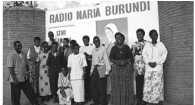
El continente africano tiene 11 países donde Radio María está presente.

Asimismo, los miembros de un mismo continente llevaron a cabo programas en común. Con la asignación de una hora de programa, cada país fue conocido por los oyentes en su realidad continental y mundial, a través de entrevistas, música típica y temas alusivos a las