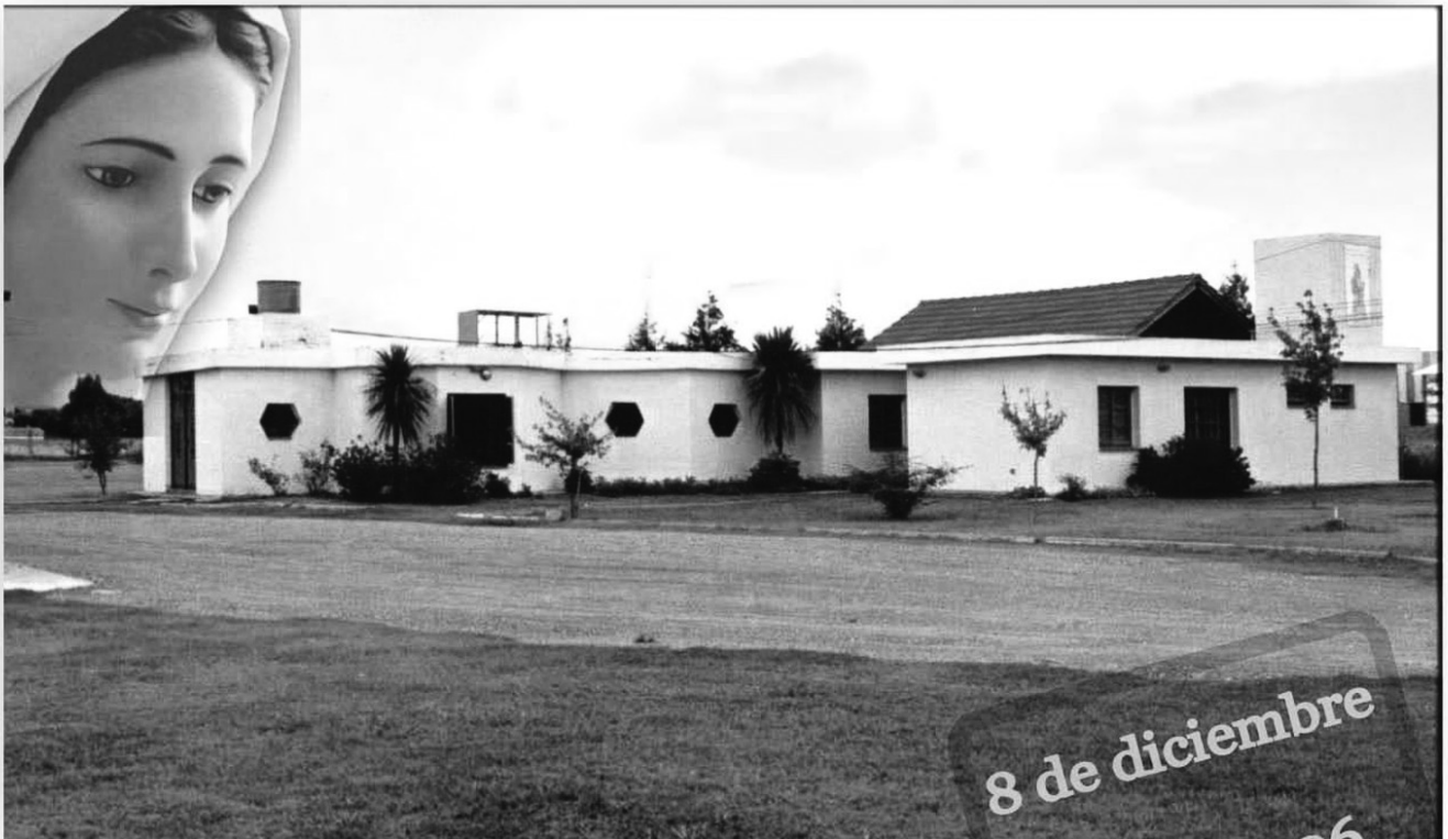
El camino de estos 10 años se recorrió bajo la mirada atenta de María.

En este mes, Radio María alcanza sus primeros diez años de camino. El gran objetivo es llegar con el mensaje evangelizador a todos los argentinos y en el horizonte asoman nuevos desafíos.