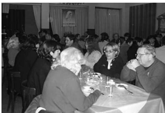
Los difusores tuvieron su encuentro en La Falda, en junio de 2005.

Finalmente, en diciembre se realizó un almuerzo con todos los voluntarios de Radio María y Hombre Nuevo, contando con la presencia de más de 500 personas. Junto a sus familiares, los voluntarios cerraron el año con la satisfacción plena de saber que su aporte es muy necesario para la vida de la Obra. ■