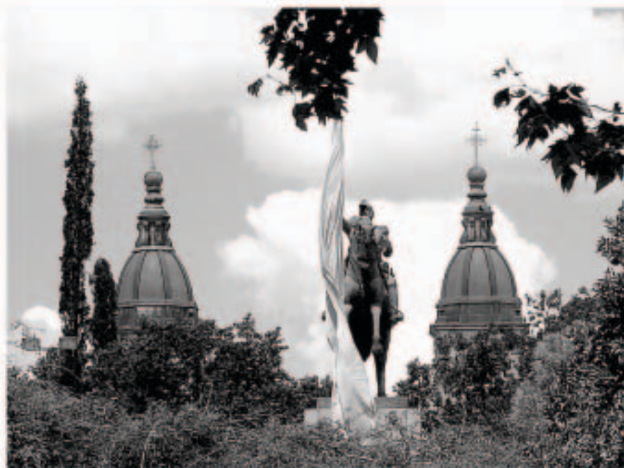
Una postal de la ciudad que es surcada por el Río Ctalamochita.