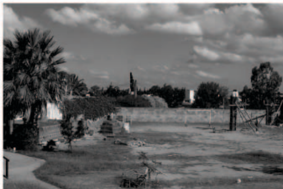
Este es el predio donde funcionará la nueva antena en Córdoba.

La nueva ubicación de la antena de Radio María en Córdoba posibilitará, debido a la proximidad a la zona céntrica y a su altura,