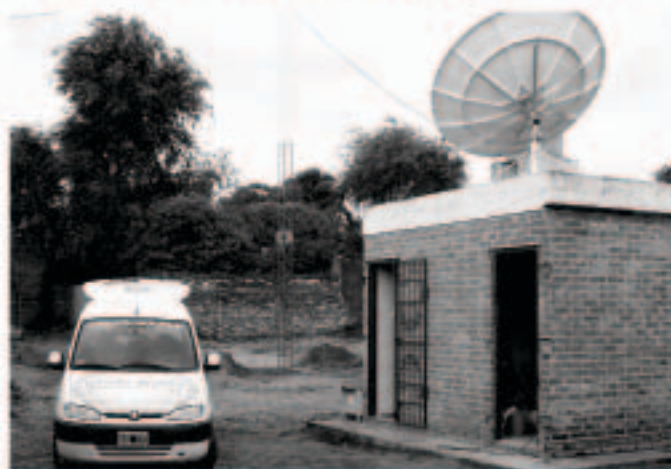
La antena transmisora está al fondo de la Capilla San Miguel.