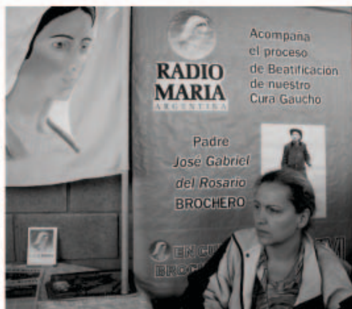
El stand se instaló en el Salón del Peregrino, de Cura Brochero.

A fines de enero, un grupo de voluntarios difusores estuvo promocionando la Radio durante la Semana Brocheriana. El Siervo de Dios José Gabriel Brochero fue un sacerdote ejemplar que supo llegar a sus fieles con un lenguaje simple y llano.