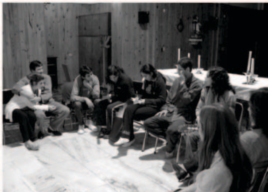
Los integrantes de Shekiná se nutren cada semana de la Palabra de Dios.

Su objetivo es la evangelización. Ellos llevan a Dios a otras comunidades, siempre a través del servicio de la música.