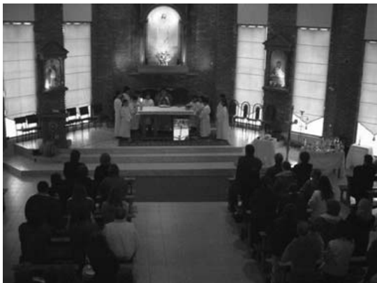
Las comunidades parroquiales deben renovarse en el espíritu misionero y evangelizador.

Una de las funciones primordiales que tiene una parroquia es dar respuesta a aquellas personas que tienen sed de Dios, a aquellos que están buscando un encuentro personal con el Señor. Sin embargo, muchas veces escuchamos que las parroquias no terminan siendo ese lugar de encuentro con el Dios Vivo sino que, muy por el contrario, esas personas nos dicen: "no, a la parroquia no quiero ir; allí me voy a encontrar a un grupo de mujeres tomando mate, hablando sobre fulano o mengano o peleándose entre ellos". Estas respuestas hacen que los buscadores del Señor no logren insertarse en ningún espacio propiamente de alimento espiritual, de formación, de búsqueda de sentido de la causa noble y trascendente que los movilizan. Entonces, nos preguntamos: ¿qué pasa en las parroquias de nuestro país? Los detalles menores como las suspicacias, las envidias, las pugnas por el poder, los comentarios, las vanidades y otras cosas por estilo afectan con dureza la pastoral parroquial.