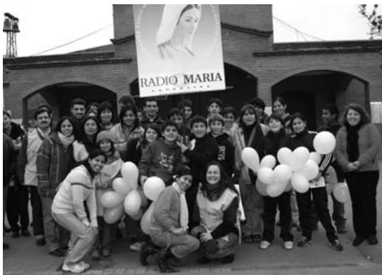
La caravana tucumana fue acompañada por las personas que la esperaban en las parroquias.