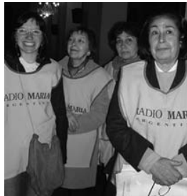
Las difusoras de Tandil no ocultaron su felicidad por la visita mariana.