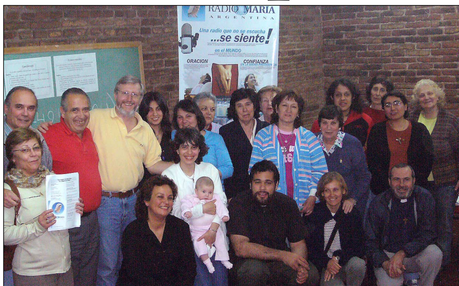
La comunidad de difusores de Tres Arroyos.

Del 4 al 12 de marzo, se llevó a cabo en Tres Arroyos la Fiesta Provincial del Trigo. Esta fiesta se realiza desde hace más de 30 años, en reconocimiento y homenaje al hombre de campo, se trata de un evento donde la industria, el comercio, los prestadores de servicios y todas las actividades vinculadas con el agro, exhiben sus productos, y su tecnología. Allí, en medio de stands, exposiciones culturales y espectáculos artísticos estuvieron los difusores de Tres Arroyos, ha-