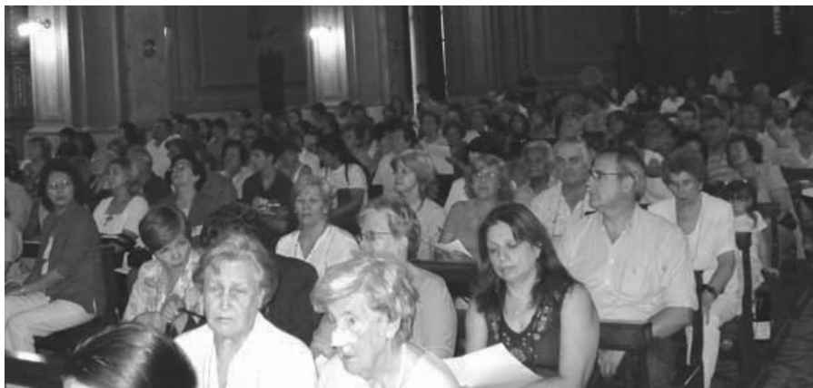
El amor a la obra quedó expresado en la presencia masiva en la Eucaristía.

El sacerdote cordobés también indicó "Se ve en el horizonte el futuro como profecía de presencia del canto mariano del Magnificad extendido por toda la nación; en los próximos dos años esperamos ver extendida la red de Radio María al 86 por ciento de la población argentina". Por último, el Padre Soteras aseguró que "nos toca trabajar y servir con humildad y confianza poniendo a Jesús en su lugar protagónico principal en el tiempo nuevo que vendrá. Para que nuestra disminución sea evangélica, el Señor nos