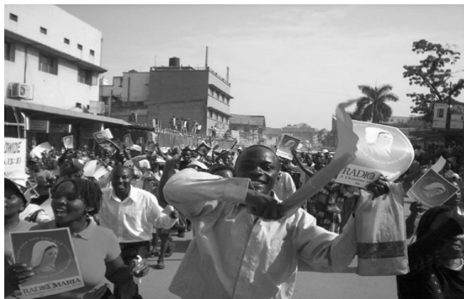
Los hermanos africanos viven con inmensa alegría la presencia radiomariana.

piloto. En una segunda instancia, este emprendimiento será una hermosa realidad en el resto del mundo donde un voluntario radiomariano sea útil. Toda la información referida a este proyecto es supervisada por la Presidencia de la Familia Mundial y en los próximos meses habrá más información en www.radiomaria.org sitio web de dicha entidad.