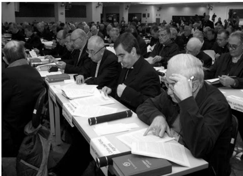
Los obispos trabajaron arduamente en Aparecida para concebir este nuevo Documento.

En otro tramo, el Padre Fernández dijo: “En Aparecida, el acento espiritual es muy fuerte, marca todo el documento. De hecho tiene tres ejes: discípulos, misioneros y la vida que Jesús nos ofrece. Se trata de expresar que nadie va a ser misionero ardiente si no tiene un encuentro personal con Cristo, si no reconoce que Cristo lo ama. Si uno no vive eso y no lo renueva todos los días, el fuego misionero se apaga. Y en cuanto a los lugares donde se puede