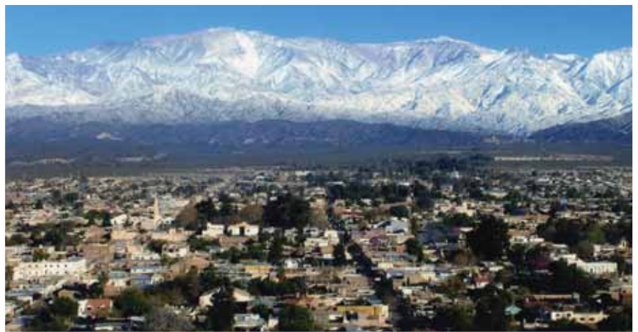
Chilecito está enclavada en un valle, al pie de la cadena montañosa del Famatina.