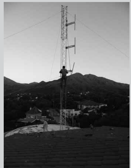
El momento en que se realizaba la instalación definitiva en Capilla del Monte.

En otro orden de cosas, el área Técnica de Radio María llevó a cabo la instalación definitiva en Capilla del Monte (Córdoba), en el 92.3 FM. El nuevo mástil de 12 metros de altura se ubicó sobre el techo del templo parroquial, permitiendo de esa forma que las localidades cercanas a Capilla del Monte, al igual que zonas rurales, puedan sintonizar la señal mariana. ■