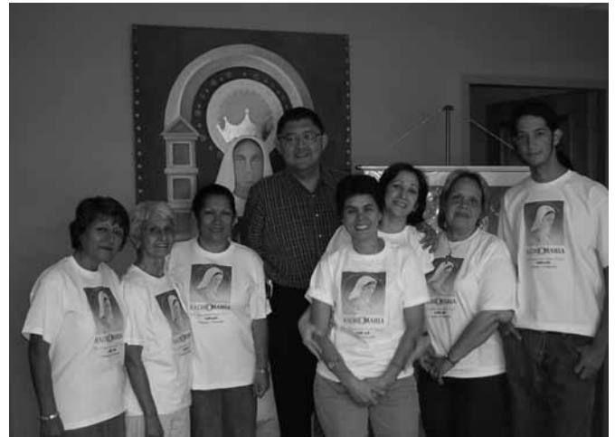
Venezuela fue una de las emisoras hermanas que participaron de la jornada.