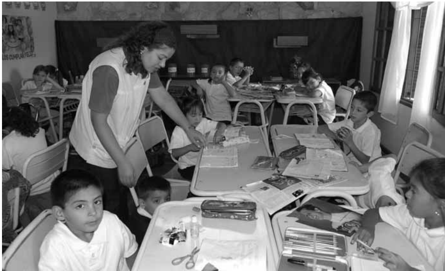
Los niños y su maestra en el aula de primer grado.

El predio que ocupara durante muchos años Radio María Argentina es hoy un centro educativo y evangelizador.