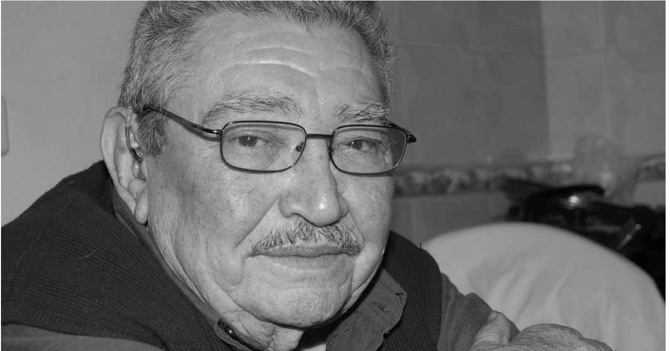
Muchos ancianos que viven solos han aprendido a convivir con su soledad.