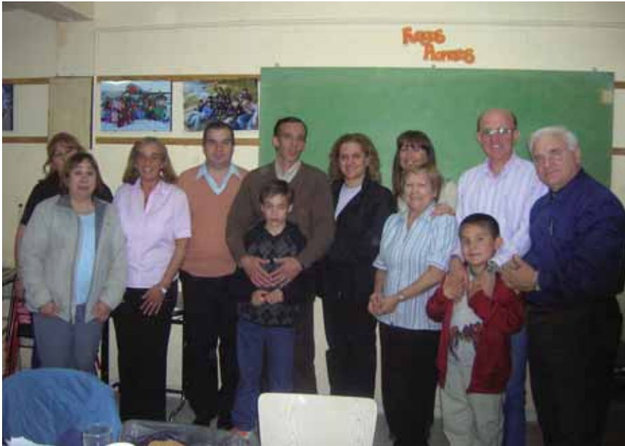
Ellos son los responsables que Radio María esté en Ushuaia.

En los últimos meses, Radio María ha incorporado 10 emisoras nuevas a su red nacional, totalizando 79 estaciones en todo el país. Así llegaron las ciudades entrerrianas de Crespo en el 102.7 FM, Paraná con el 102.3 FM, Concordia en el 95.3 FM y Colón en el 90.9 FM. En la provincia de Corrientes, Radio María ya se puede escuchar en Curuzú Cuatiá en el 92.9 FM, Saladas en el 106.7 FM, Mercedes en el 104.1 FM y Empedrado en el 103.5 FM. Y desde el sur argentino llegó Ushuaia (Tierra del Fuego) en el 88.3 FM y Caleta Olivia (Santa Cruz) en el 94.5 FM.