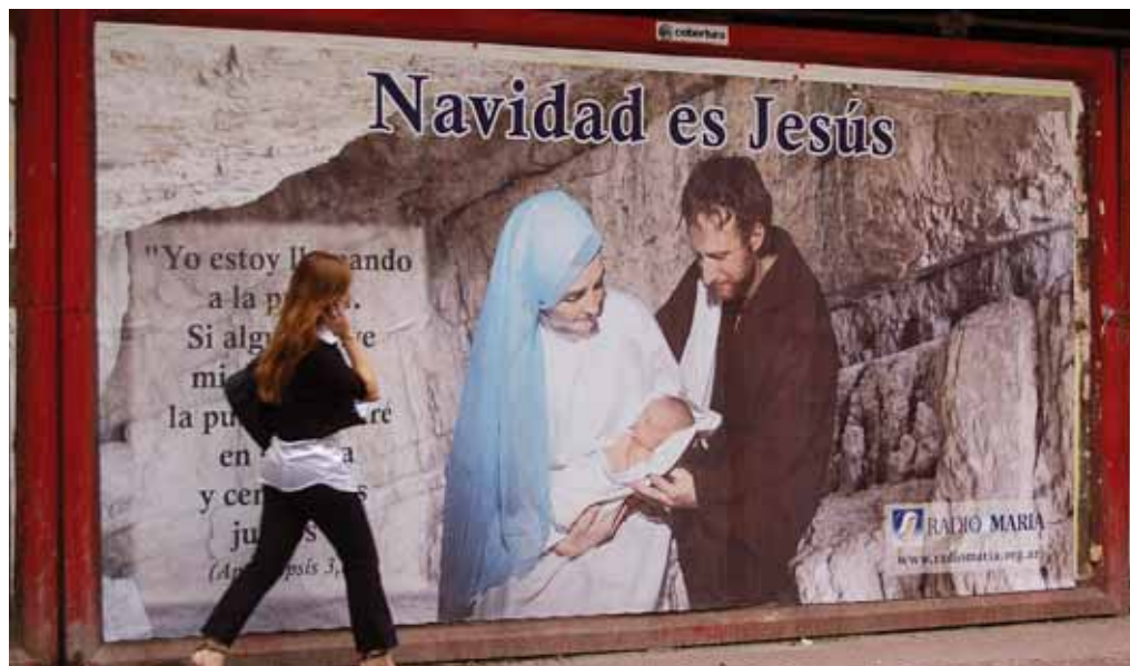
En Córdoba hubo carteles de la campaña en la vía pública.

En definitiva, todo confluyó para que esta campaña llegue al corazón de las personas, el pesebre interior que todos tenemos, y movilice a cada uno