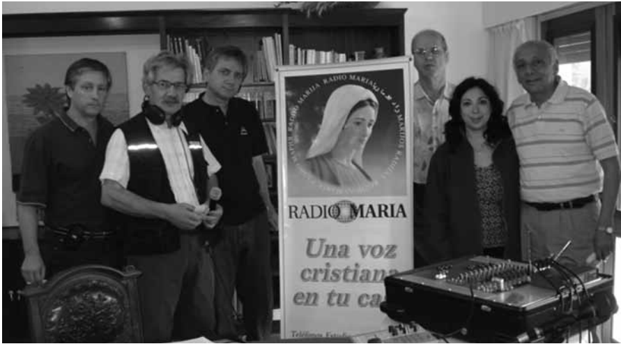
El equipo completo de transmisión de "En Casa".

Radio María transmitió el programa "En Casa" del sábado 25 de octubre desde la Mariápolis Lía, ciudadela del Movimiento de los Focolares ubicada en la localidad bonaerense de O'Higgins. Asimismo, el domingo 23 de noviembre tuvieron lugar los festejos por los 40 años de esta Mariápolis y Radio María nuevamente estuvo presente.