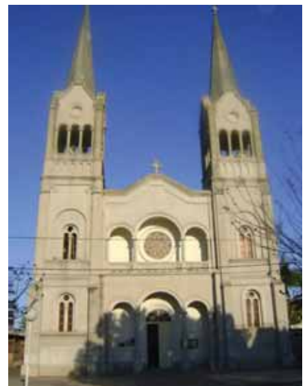
Una de las parroquias de la ciudad de Crespo, donde ya está la Radio.

diocesano, para que la palabra del Evangelio llegue a cada hogar de esta Iglesia particular. Esto a nosotros nos suscita una profunda Acción de Gracias a Dios por tanta generosidad sabiendo que a tantas almas llega una palabra de esperanza, palabra que no es otra que la Vida de Dios".