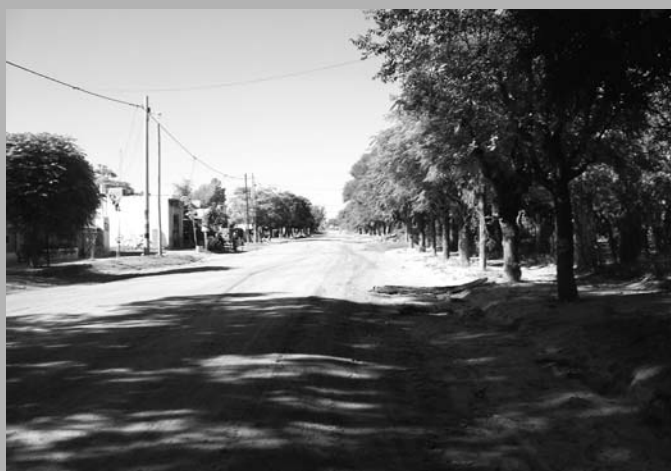
Este es el paisaje que presente Obispo Trejo a los visitantes.