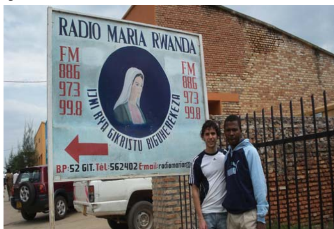
En Radio María Ruanda, junto a su compañero de tesis.