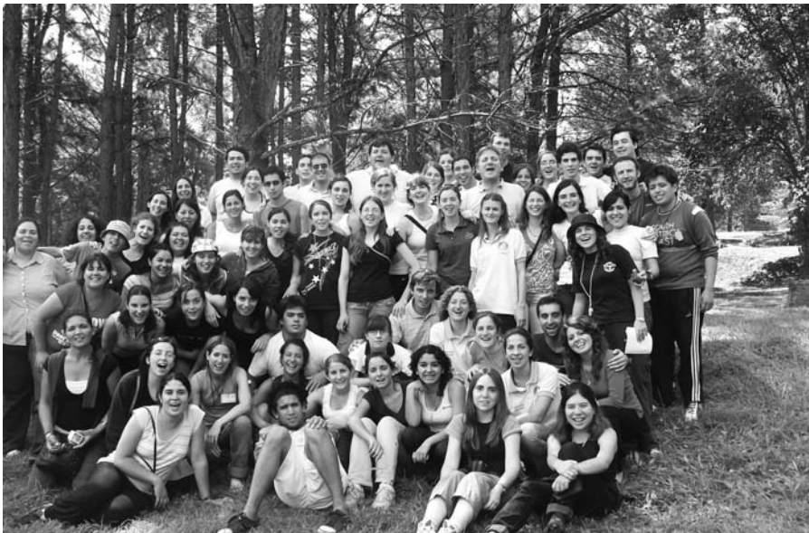
Una postal del grupo de jóvenes que participó de la acampada.