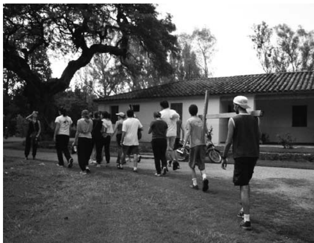
El momento en que iniciaban la caminata con la cruz.