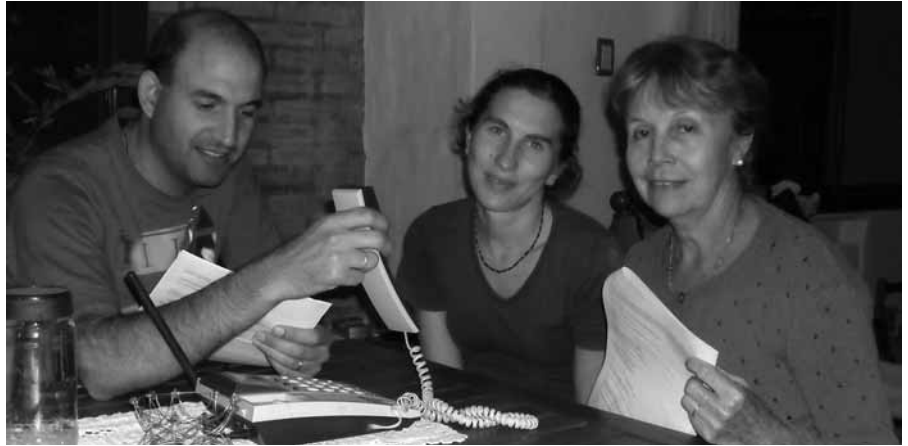
En Merlo, las transmisiones de las distintas oraciones se realiza con mucho gozo.

En la otra punta de Argentina, los hermanos de Bariloche (Río Negro) también manifiestan su alegría por recibir a María diariamente. "Este proyecto nace en el año 2004 cuando se empezaron a hacer los contactos con la gente de Córdoba para traer la Radio, y pasaron 5 años de espera, oración y trámites hasta que el 3 de marzo de 2009 se emitió por primera vez la señal en Bariloche.