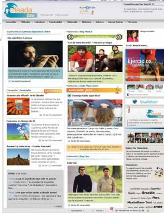
Así quedó la home del sitio web de la Oleada Joven, tras los cambios.

La red social www.oleadajoven.org.ar sigue creciendo y ya suma a más de 3.500 usuarios que participan del sitio desde distintos puntos de Argentina y de otros países. Los usuarios intercambian ideas y testimonios, chatean y suben sus propios materiales de interés. En este tiempo, la Oleada Joven presenta nuevas secciones para continuar animando la participación y brindar contenidos que respondan a sus búsquedas e intereses. Dentro de los pilares en los que se basa esta red social con valores, uno hace hincapié en la transformación de la realidad. Los jóvenes creemos en que el mundo puede ser diferente, pero no nos quedamos en meras ideas, sino que queremos materializarlas. Muchos ya lo vienen haciendo, por eso generamos una sección de "Jóvenes en acción", en donde compartimos realidades de diferentes grupos, asociaciones y ONGs juveniles que trabajan para generar un cambio. Saber que otros jóvenes se ponen en marcha para transformar el mundo resulta interperador y motiva a la acción.