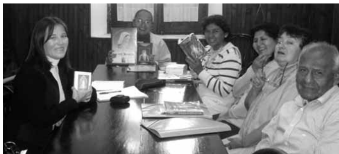
Parte de los difusores que animan a la comunidad a escuchar la Radio en Salta.

increíble cuantos hombres y mujeres que en las rutas solitarias de la Patagonia, acongojados por los problemas y los dramas de la vida, son acompañados por María. Ella los consuela con los Rosarios de fe, solo sabe Dios a cuantos a tocado y los ha recuperados a la vida a través de este instrumento que es la Radio".