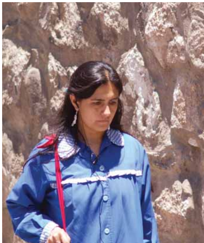
Suele ocurrir que los docentes expresen cansancio o desinterés por el servicio que brindan a sus alumnos.

Setto agregó que "en cuanto al docente, el sentimiento de soledad es un sentimiento personal,