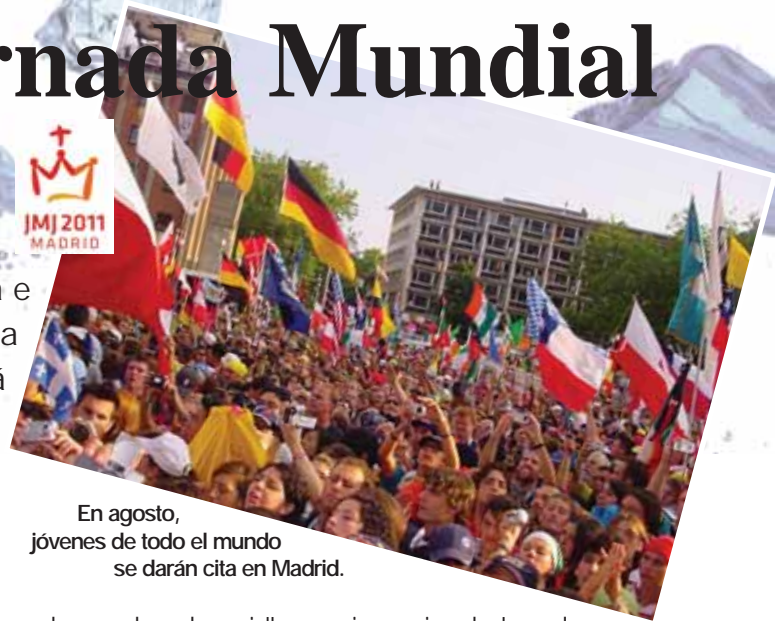
En agosto, jóvenes de todo el mundo se darán cita en Madrid.

Un grupo de jóvenes de Radio María Argentina e integrantes de la Oleada van a participar de la Jornada Mundial de la Juventud que se llevará a cabo en Madrid a mediados de agosto. Habrá transmisiones en vivo de distintos momentos de este gran encuentro.