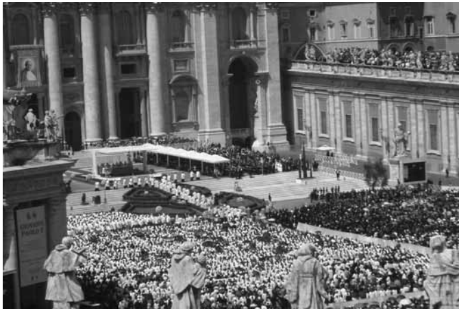
Esta era la panorámica que tenían de la Plaza de San Pedro el día del gran evento.

La ceremonia de beatificación de Karol Wojtyła tuvo cinco momentos diferentes. El primero de estos momentos fue la vigilia de preparación que se realizó el sábado por la noche en el Circo Máximo de Roma. El segundo momento fue la ceremo-